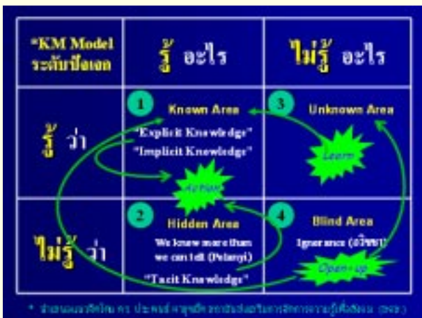
รูปที่ 4: หน้าต่างความรู้ ประตูปัญญา (3)

หากจะเปรียบเทียบความรู้ทั้ง 3 ประเภทนี้กับรูปภูเขาน้ำแข็ง (ดูรูปที่ 2) ส่วนที่อยู่บนยอดภูเขาน้ำแข็งที่เห็นได้ชัดเจนมาก ก็น่าจะเป็นความรู้ส่วนที่เป็น Explicit Knowledge ถัดลงมาบริเวณปริ่มๆ ผิวน้ำพอลเห็นลางๆ ก็คือส่วนที่เป็น Implicit Knowledge คือรู้แต่อธิบายให้ฟังค่อนข้างลำบาก ส่วนความรู้ประเภทสุดท้ายที่อยู่ลึกมากจนแม้แต่เจ้าตัวเองก็ยังไม่รู้ว่าตนเองรู้ก็คือ Tacit Knowledge ซึ่งอยู่ลึกลงไปใต้น้ำ แต่ไม่ว่าเราจะเรียกความรู้เหล่านี้ว่าอะไรก็ตาม ความสำคัญของแนวคิดแบบ KM อยู่ตรงที่ว่า เราทำอะไรกับความรู้เหล่านั้น เราสามารถนำความรู้เหล่านั้นมาใช้ประโยชน์ คือนำออกมาเป็น Action ได้หรือไม่ สามารถนำไปสู่การพัฒนา งาน การสร้างคุณภาพ หรือสร้างนวัตกรรมได้หรือไม่