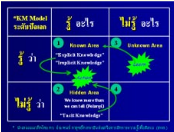
รูปที่ 3 : หน้าต่างความรู้ ประตูปัญญา (2)